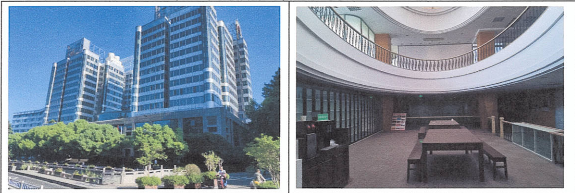
河坊街 58 号