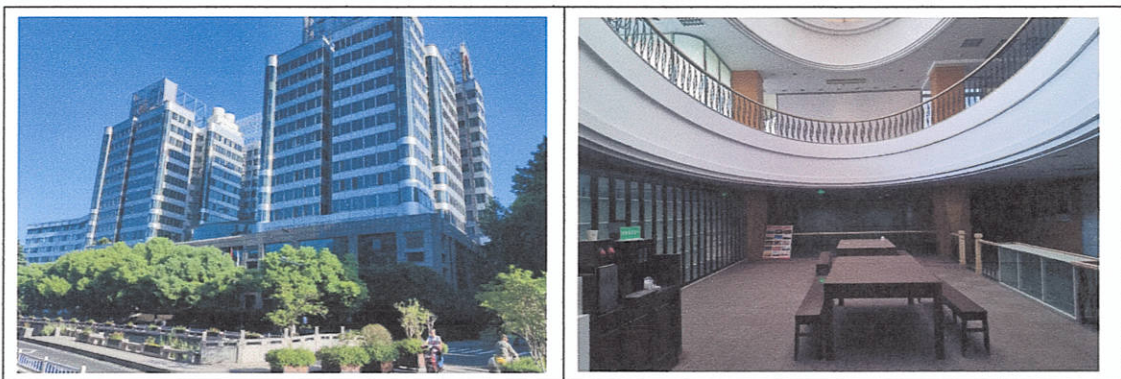
河坊街 58 号